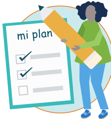
Haz un plan