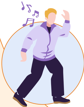
Prueba algo nuevo