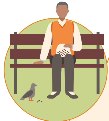
Manten tu ritmo