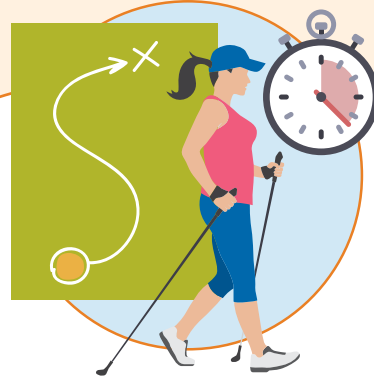
Divide una actividad por partes