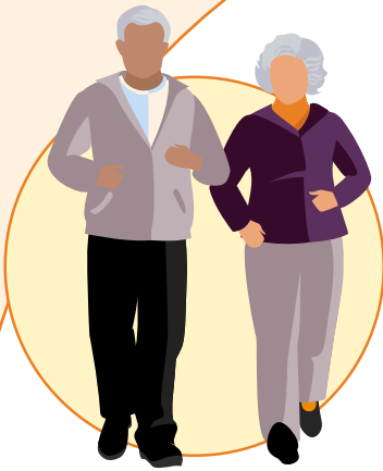
Rodeate de personas