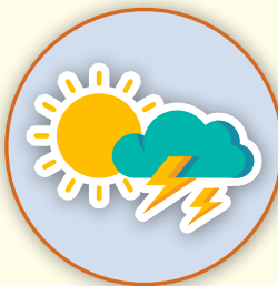
Estado de ánimo